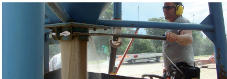
Bij het vullen van de instrooikar (zand of rubber) wordt rekening gehouden met de windrichting (medewerker blijft bovenwinds) of blijft de medewerker op voldoende afstand (NB op deze foto ontbreekt een windstopper aan de trechter).