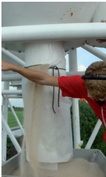
Aan de trechter van de zandsilo is een windstopper geplaatst.