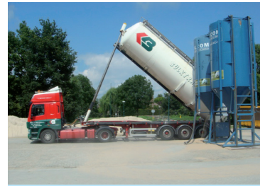
Zandsilo vertoont geen ernstige lekkages tijdens lossen bulkwag.