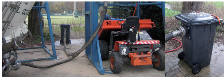
Bij het lossen van bulkwagens zand wordt een goed werkende waterbak gebruikt. Deze waterbak wordt benedenwinds geplaatst.