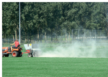
Bij instrooien rekening houden met de windrichting (tegenwinds of dwars op de wind).