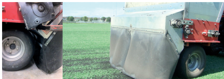
De instrooikarren zijn voorzien van functionele windflappen, voor- en achter de strooizijde.