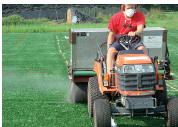
Bij instrooien van zand en als de medewerker erom vraagt altijd een stofmasker FFP3 dragen (NB dit geldt voor alle medewerkers op en rond het veld tijdens werkzaamheden met zand).