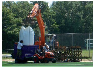
Laden instrooikar rechtstreeks uit de big bag.