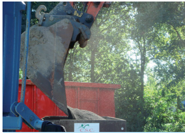
Laden instrooikar rechtstreeks uit de container.