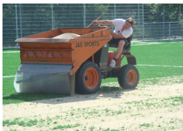
De instrooikarren zijn voorzien van functionele windflappen, voor- en achter de strooizijde.